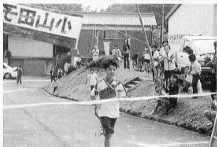
優勝 鹿間町！みんな頑張りました