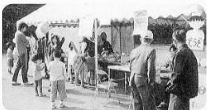
毎年食べものコーナーは売り切れゴメンで大好評