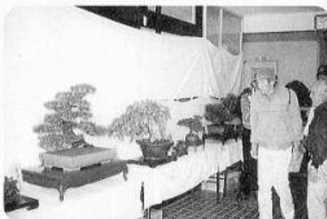
丹精こめた盆栽に皆おもわず足がとまります