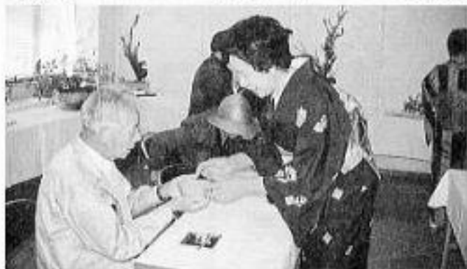
お茶サークルさんによる美味しいお抹茶サービス 結構なお手前でした。