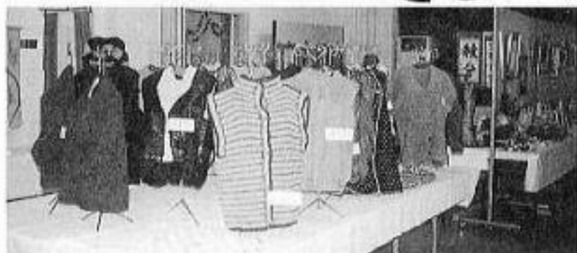
素敵な作品が多数出品されました。 これからも素晴らしい作品をお願いします。