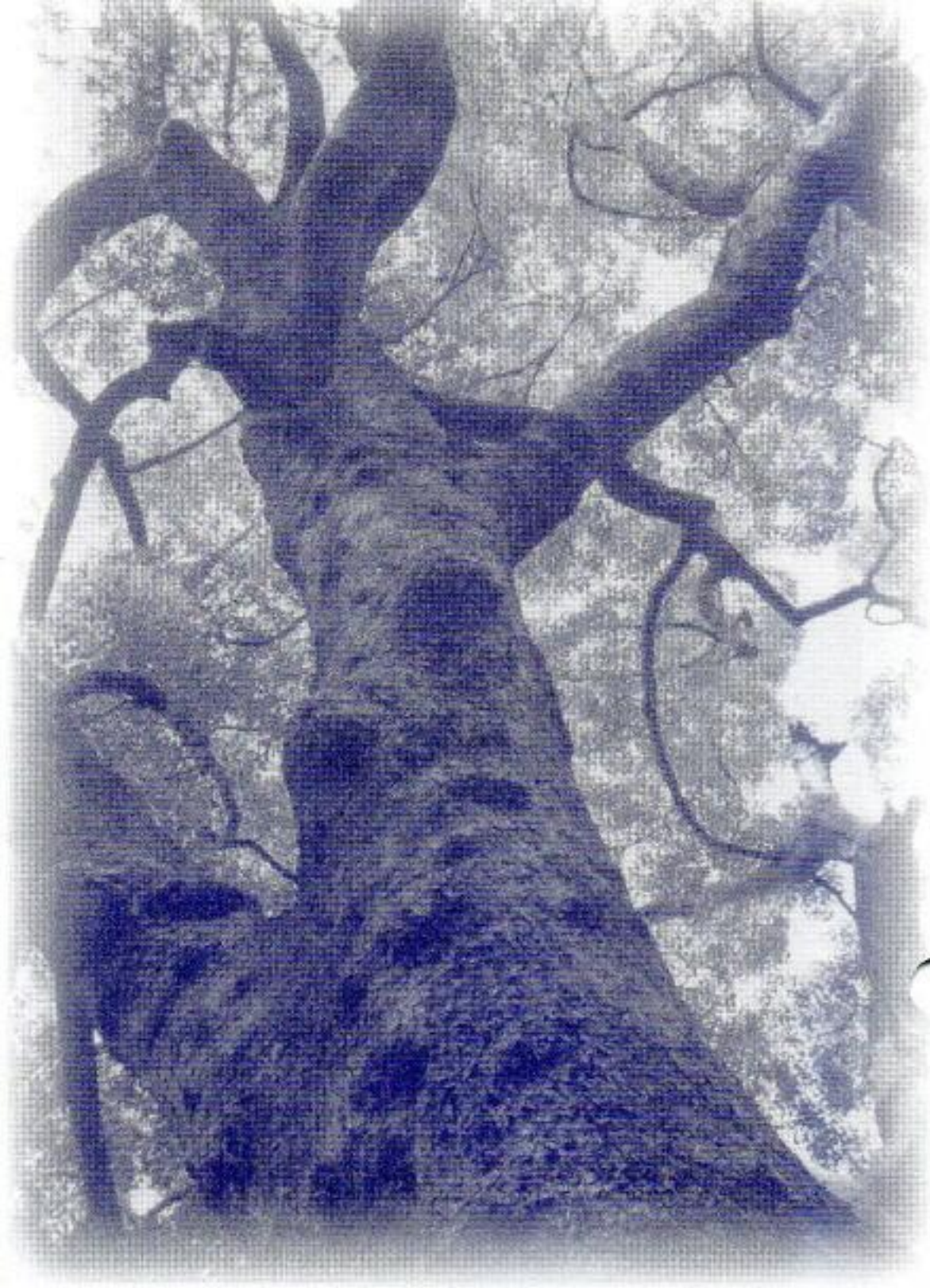
天に突きぬける大樟

この大樟は堂ヶ山町神明社境内にあり、町集落の発祥以前から自生し、約八百年余り経過していると推定されている。