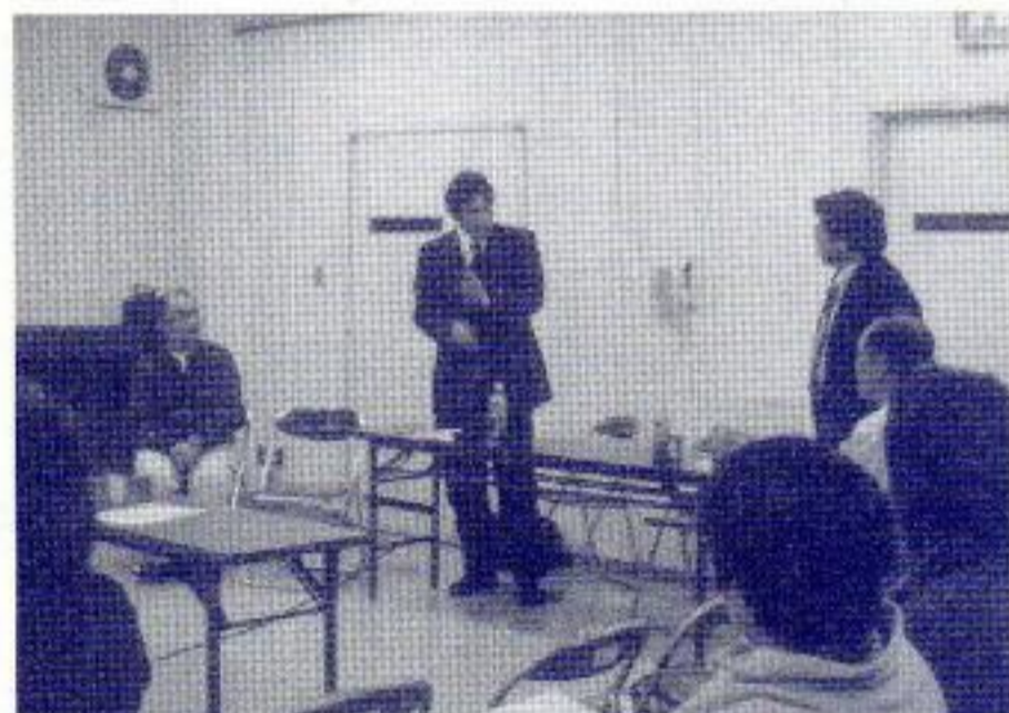
西陵中学校長を迎えて、家庭教育講座

小山田っ子は、地区全員で守り、四日市市で一番の健全な青少年の町にしていきたいものです。