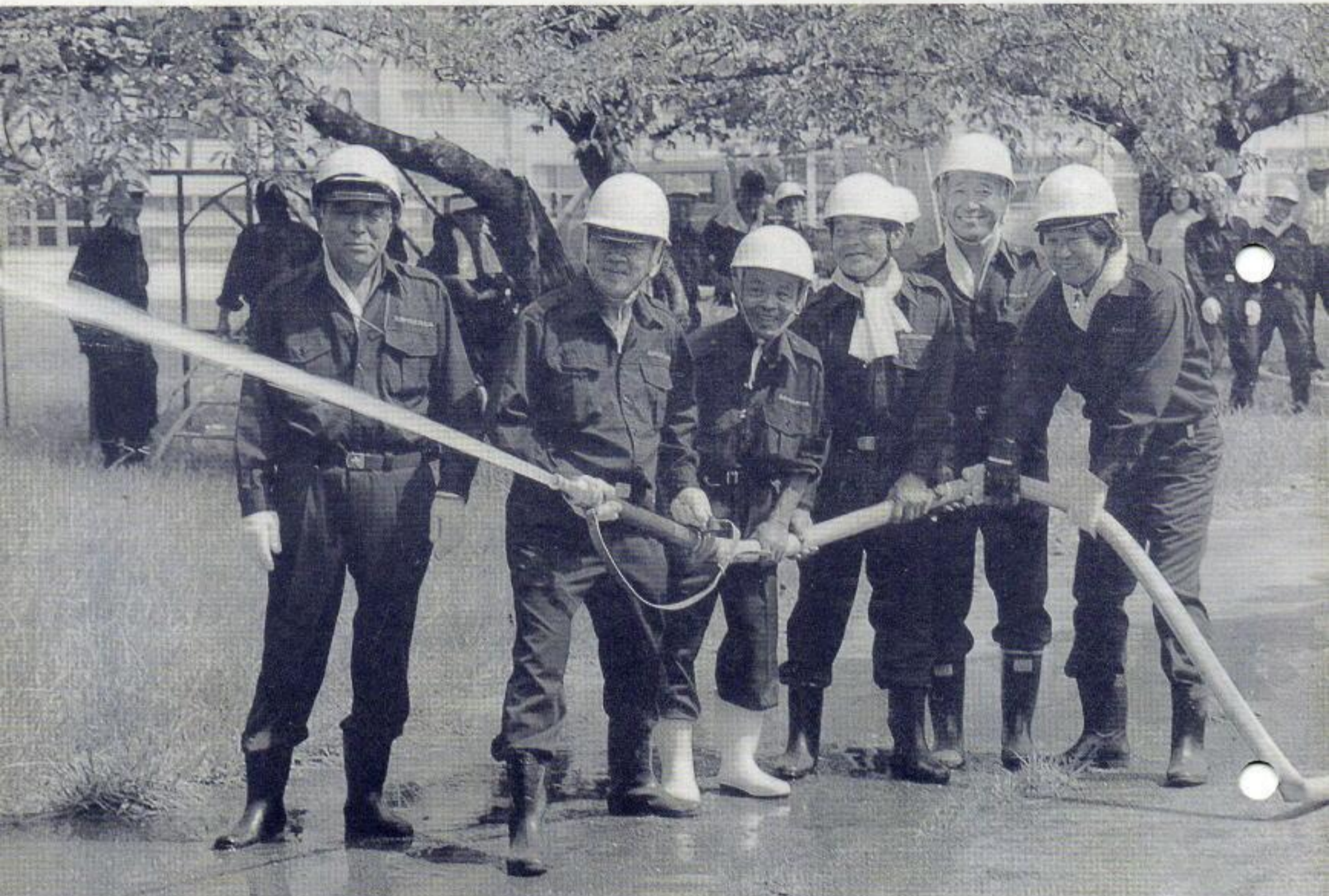
防災訓練で放水をする鹿間町自主防災隊員たち＝小山田小学校で