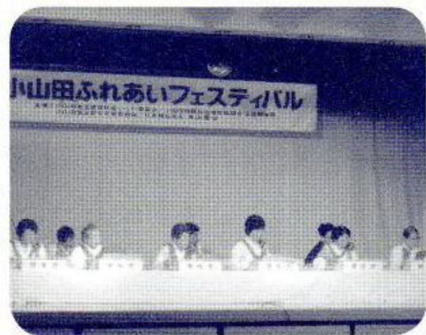
おとしよりの前で=びあホール。中央が筆者