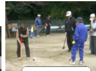
同時開催の グランドゴルフ大会