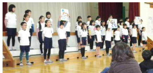
3年生「ありがとう友よ！」