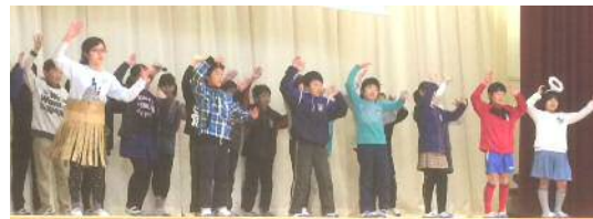
5年生「喜劇 浦島太郎」