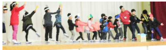
1年生「ありがとう6年生！」