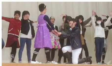
6年生「小山田国のシンデレラ」