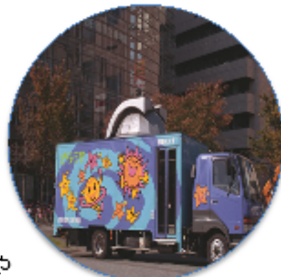
移動天文車 きらら号

※気象条件等により移動天文車が配車されない場合や、蛍や星が見られない場合がありますので、予めご容赦ください。