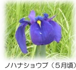
ノナショウブ（5月頃）

【問合せ】四日市市教育委員会 社会教育・文化財課 TEL 354-8238、Eメール syakaibunkazai@city.yokkaichi.mie.jp