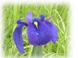
ノハナショウブ（5月頃）

【問合せ】文化課 TEL 354-8238/Eメール bunka@city.yokkaichi.mie.jp