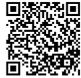
申込専用フォーム

※10月28日(土)にも託児付きのワークショップ(内容未定)を予定しております。