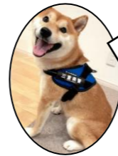
四日市南警察署 広報犬「豆助」

【三重県交通安全協会会長表彰】 〈交通安全優良学校〉西陵中学校 〈交通安全協会優良支部〉四日市南地区交通安全協会 小山田支部