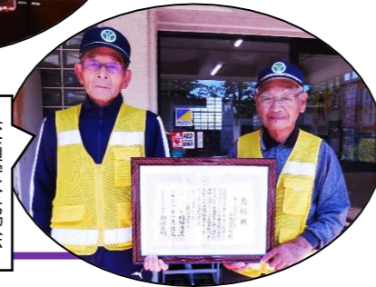
交通安全協会 小山田支部

【三重県交通安全協会会長表彰】 〈交通安全優良学校〉西陵中学校 〈交通安全協会優良支部〉四日市南地区交通安全協会 小山田支部