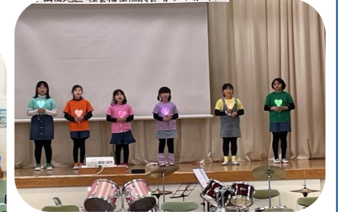
小山田地区社会福祉協議会 青少年育成部