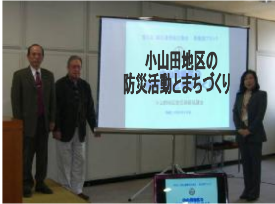
第5回四日市市自治会連合会情報交換会が、2月24日(金)に開催され、西南部ブロックを代表して小山田地区が、『小山田地区の防災活動とまちづくり』について発表しました。