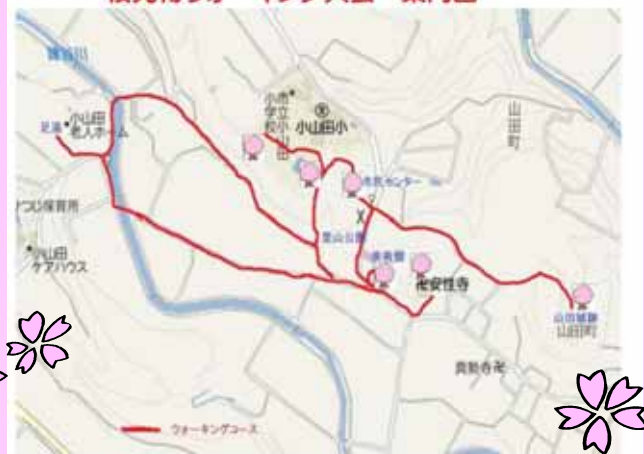
桜見物ウォーキング大会 案内図