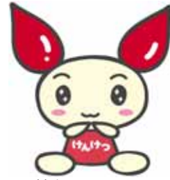
献血キャラクター 「けんけつちゃん」