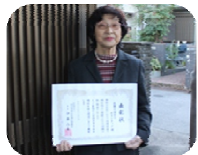
衣類の仕分けボランティア さん (青山里会)