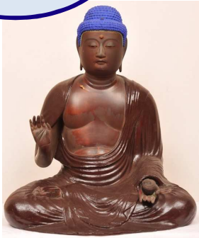
木造薬師如来坐像

平成29年3月22日、堂ヶ山町の遠生寺所蔵の木造阿弥陀如来坐像及び木造薬師如来坐像が、四日市市指定有形文化財に指定されました。