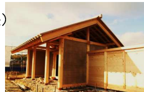
八脚門復元建築中写真