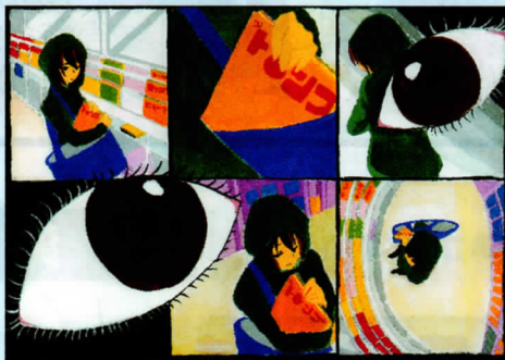
鈴鹿地区 中学生 金森 菜摘