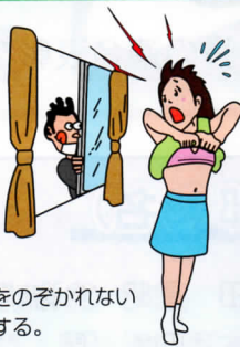
家の中をのぞかれないようにする。