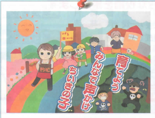
原画 / 古田知沙都さん(中2, 愛知県) 標語 / 有澤乃慧留さん(小4, 富山県)