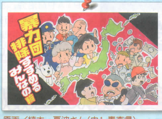
原画 / 植木 夏波さん(中1, 青森県) 標語 / 福田菜那子さん(中1, 群馬県)