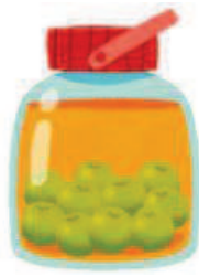
うめ しゅ 梅酒